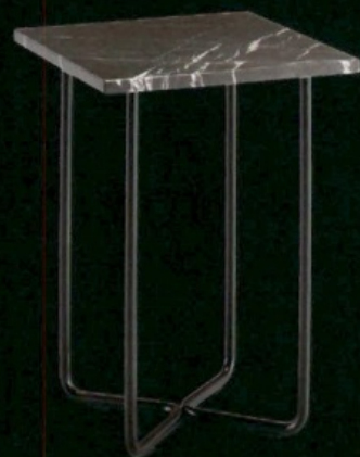
Quattro Design Mist-o- Frag