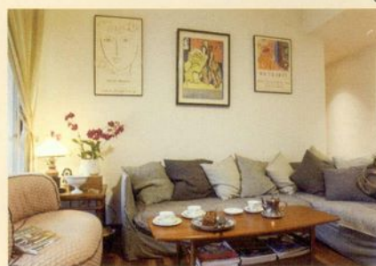
1 サンプルームの棚にはヨーロッパの食器類が。2 大のティディベア好きで、毎年一つは購入。旅行の際には必ず連れていく相棒。隣は30年前のヴィンテージの〈エルメス〉のバッグ。3 昨年出版した著作。4 サンプルームの椅子の下にも器が積まれている。壁に飾られた絵は元同僚の作品で、台東の海と稲穂がモチーフ。5 インドの古い研磨器具を再利用したというテーブル。なかにはお気に入りのキャンドルや花瓶、器などが。チェロは一時期習っていた。6 2019年にリフォームした際に購入した〈GERVASONI GHOST 12〉というブランドのソファ。壁のポスターはアンリ・マティスの絵。7 広々とした玄関には市場で買った花が。

台北市の郊外、故宮博物院にも近い外雙溪沿いの築40年の集合住宅。シルビアと家族は20年ほど前、ここに引っ越してきた。 「当時はビーグル犬を飼っていたので、1階にある部屋を探していたのです。ここは公営住宅で、デザインは簡素でしたが、インテリアデザイナーと相談しながらリフォームをしました」。もともとは建物の横に玄関があったが、正面に独立した玄関を設けた。これにより庭付き一軒家のような雰囲気生まれた。また、キッチンとダイニングの間には小さな部屋があったが、料理をしながらおしゃべりできるようにと、これを取り払った。さらにダイニングの奥にはサンプルームを増築。「ここでは樹木が茂る裏庭を眺めながら、レコードを聴いたり、本を読んだりして過ごします」。室内面積は41坪。窓が大きめなのでより広く感じられる。備え付けの家具はほとんどなく、アンティーク家具を置くことで、部屋全体にぬくもりを与えている。 驚くのは棚の中に並ぶアンティークやヴィンテージの食器の数々。(ロイヤルコペンハーゲン)や(アラビア)といった北欧ブランドから中国の茶器、さらには日本統治時代に台湾で使われていた器なども。こちらは永康街にある「錦安市場 昭和町文物市集」で見つけたものだという。「アンティークは27歳の頃から