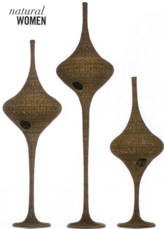
Sopra, le lampade in rattan Spin disegnate da Paola Navone ( paolanavone.it ) per Gervasoni sono ispirate ai nidi ( gervasoni1882.com ).